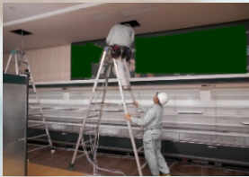
※脚立の跨ぎ作業は禁止