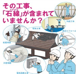
厚生労働省ポスター

弊社としても国からの通達に従うよう、都道府県や環境省、厚生労働省に確認をしながらマニュアルの整備、電子システムのメンバー登録、社内教育等を進めております。