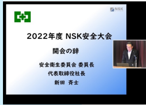
開会の辞 代表取締役社長

弊社の毎年恒例の行事となっております、安全大会を今年は6月15日に全国合同で「Zoomウェビナー」を利用して開催しました。東京・名古屋・大阪・福岡地区では人数制限を設けて会場に人を集め、その他の地区及び会場に参加出来ない方々にはオンラインで参加して頂き、社員、全国の施工パートナー様合わせて総勢355名に参加頂きました。内容としては安全衛生委員会の重点施策等々や形骸化させてはならない事故事例の共有とその対策、また各会場から安全パトロール報告、安全表彰者及び安全標語優秀作品受賞者の発表を行うなど、情報共有出来たことは大変重要な場であると改めて感じました。その結果、アンケート回答では「非常に良かった」、「良かった」を合わせると97.7%と高評価を頂きましたが、反省点も多く次回開催では更なる評価を得られる安全大会を目指して行きたいと思っております。この安全大会を通じて現場の安全・品質に対する意識が高められ、今後もお客様にご満足頂けますよう無事故・無災害・高品質の施工を行ってまいります。