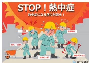
国土交通省ポスター

気象庁の長期予報によると、今年の夏の気温は全国的に平年より高くなる予想となっています。弊社では現場での熱中症対策として、こまめな休憩・水分補給等を取るよう指導しているとともに、救急箱および経口補水液や瞬間冷却剤等の熱中症キットを各現場に配置し、現場で熱中症が発生した際の救急処置等の社内アナウンスも行ってまいります。また、現場責任者は現場での朝礼時に作業員一人ひとりの体調を確認することを徹底しています。マスク着用での作業により熱中症になるリスクも考えられますが、熱中症対策と新型コロナウイルス対策を日々実施し、安全な作業を心掛けて事故の無い現場を作ってまいります。