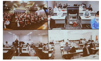
東京・名古屋・大阪・福岡の同時中継