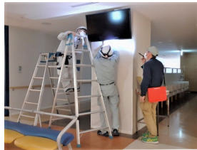
肩掛けフォルダー

5月に実施した安全パトロールをご紹介します。 某病院様の院内各所に設置されている「ご案内モニター」の伝送装置取替作業が行われている現場のパトロールを実施しました。院内では患者、スタッフの方の通行もあり、作業時には第三者との接触や資材・工具等の置きによる転倒災害が想定されます。作業エリアでは細心の注意が必要となり、脚立作業時の作業員の動作範囲、資材等が適切な位置に仮置きされているか、第三者との接近や通行を常時、監視する者を配置していました。また、施工関連の図面や配線系統等の資料は穴あけフォルダーに収納し、資料の抜け落ちや散乱が無いようにしていました。現場責任者は肩掛け用の紐の付いたフォルダーを採用し、資料紛失や置き忘れが無いように、常に資料フォルダーは肩から掛けた状態で現場を移動して施工管理を行っていました。