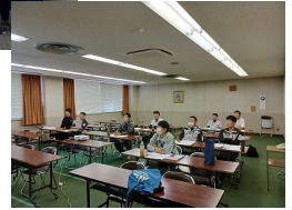
職長・安責者 教育風景