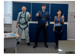
フルハーネス型 特別教育教育風景

建設現場では「安全第一」がすべてに優先されます。そのためにこのような公的資格教育等を開催することで、社員と施工パートナー様が現場に必要な知識と技能を習得し、ルール厳守に努め、事故防止につながってまいります。