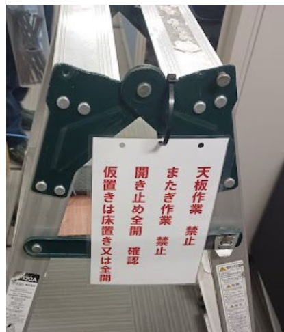
脚立への注意喚起プレートの掲示

TBM/KY時の言葉での啓蒙だけではなく、可視化することにより作業時に確認することができ、適正に使用できます。