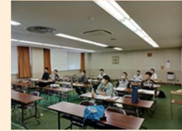
職長・安全衛生責任者 教育風景