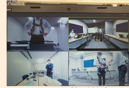
フルハーネス特別教育 風景 (リモート)